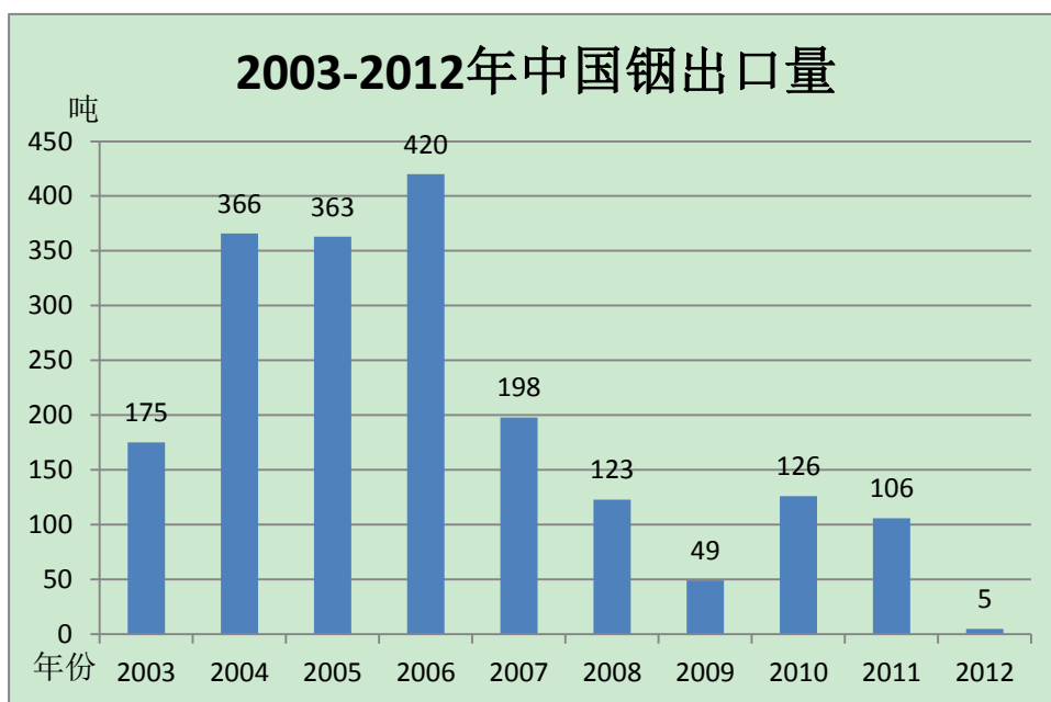
图 2 :2003-2012 年中国钢出口量