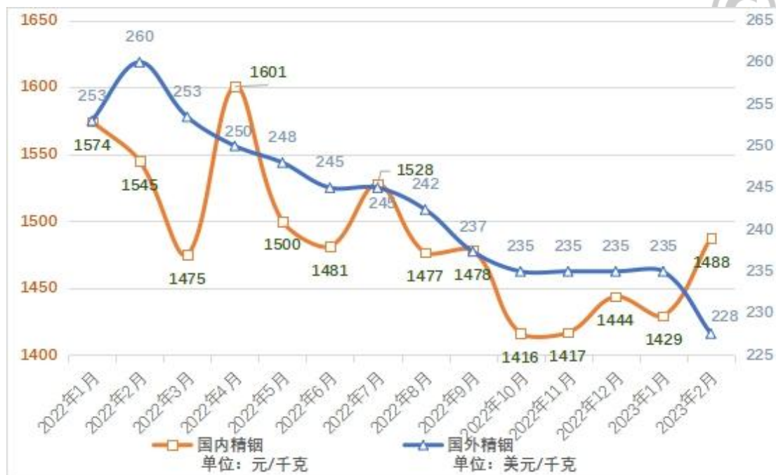
图 1-1：2022-2023 年 2 月国内外精钢价格走势

2023年2月安泰科精钢报价均价为1488元/千克，同比下降3.72%，环比增长4.07%。2023年2月国外精钢报价均价为228美元/千克，同比下降12.47%，环比下降3.16%。